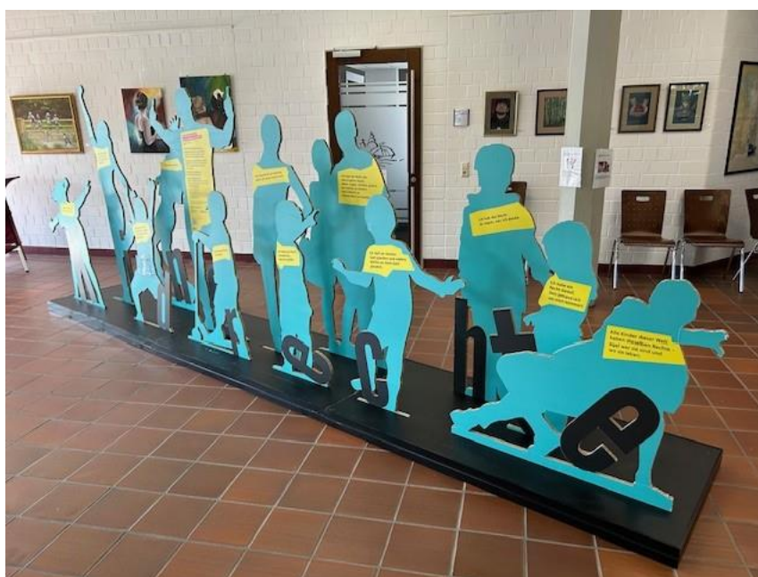
Kinderrechteausstellung zum Weltkindertag 2024