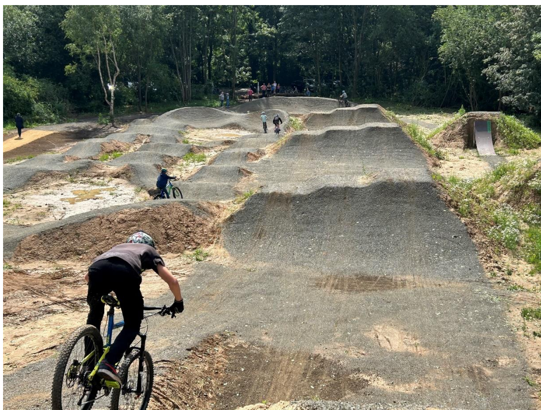
Bikepark Haren (Ems)

Das Siegel bedeutet für die Stadt Haren (Ems) gleichzeitig Herausforderung, Verpflichtung und Ansporn für die Umsetzung dieses Aktionsplans.