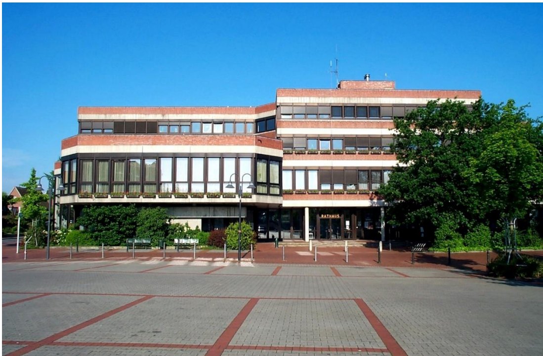
Rathaus der Stadt Haren (Ems)

Parallel zur Konzepterstellung und der Beschlussfassung erfuhren Politik und Verwaltung von den Aktivitäten des Vereins Kinderfreundliche Kommunen e.V. Die mögliche professionelle Begleitung der Umsetzung des Konzeptes sowie der Austausch mit den übrigen Kommunen im Prozess führte in der Sitzung des Stadtrates am 20.12.2022 zum Mehrheitsbeschluss, die Stadt dem Zertifizierungsverfahren zu stellen. Am 05.10.2023 wurde die Vereinbarung mit dem Verein Kinderfreundliche Kommunen e.V. dazu unterzeichnet.