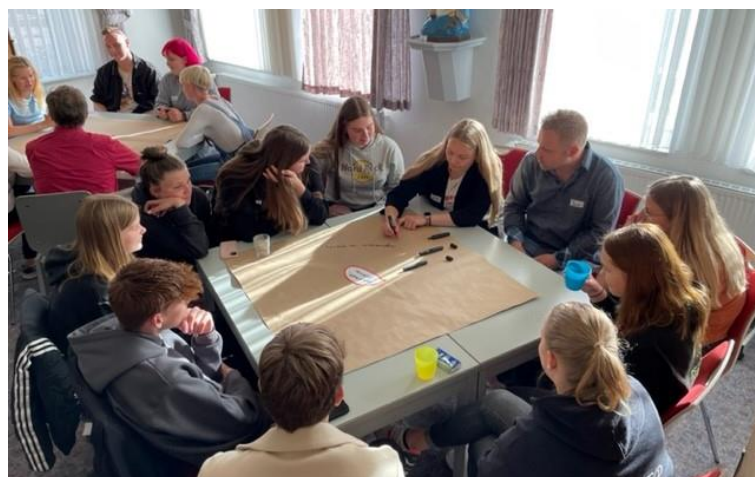
Workshop bei einer Jugendkonferenz 2022

Die Jugendkonferenzen fielen dann zunächst wegen der Corona-Pandemie aus und konnten erst 2022 nachgeholt werden. Es ergaben sich ganz neue Herausforderungen und Prioritäten, wie man gemeinsam den veränderten sozio-kulturellen Szenarien begegnen muss. Aus der Jugendbeteiligung wurde dann folgendes Kinder- und Jugendkonzept in der Sitzung des Stadtrates am 13.10.2022 einstimmig beschlossen: