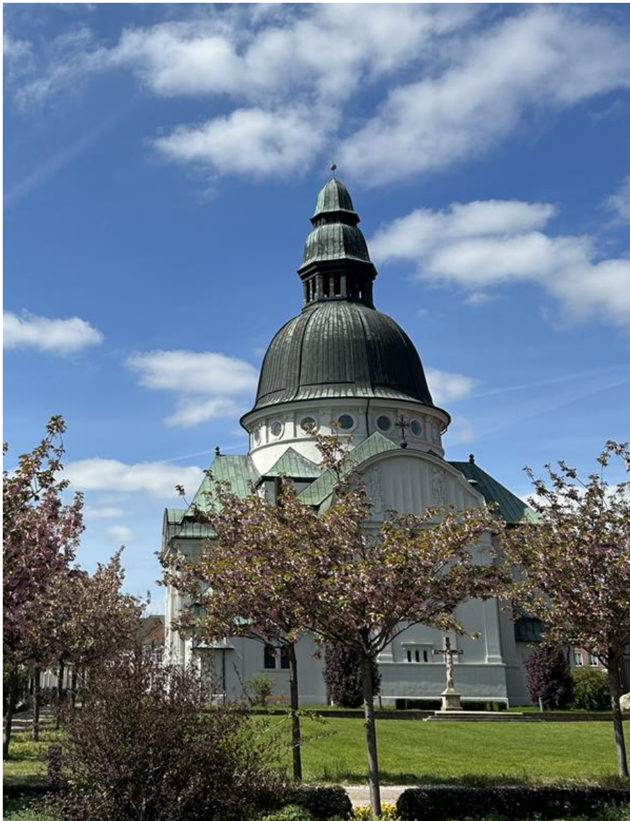
St. Martinus-Kirche (im Volksmund „Emsland-Dom“ und Wahrzeichen Harens)

Mit der konsequenten Umsetzung dieses Aktionsplans stärkt die Stadt Haren (Ems) die gesellschaftliche Beteiligung von Kindern und Jugendlichen, überträgt ihnen Verantwortung, begleitet Prozesse hauptamtlich und stärkt Strukturen und ihre Akteure. Ziel ist es, Orte zu schaffen, an denen Kinder und Jugendliche ihre Rechte und Potenziale voll entfalten können, um die Kinderfreundlichkeit der Stadt Haren (Ems) nachhaltig zu erhöhen.