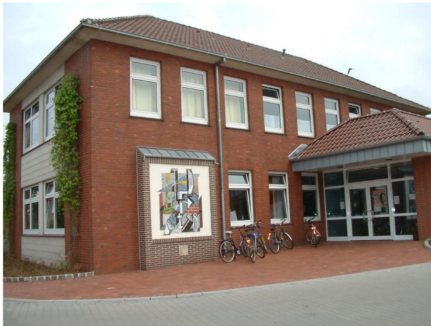
Jugendzentrum Haren (Ems)