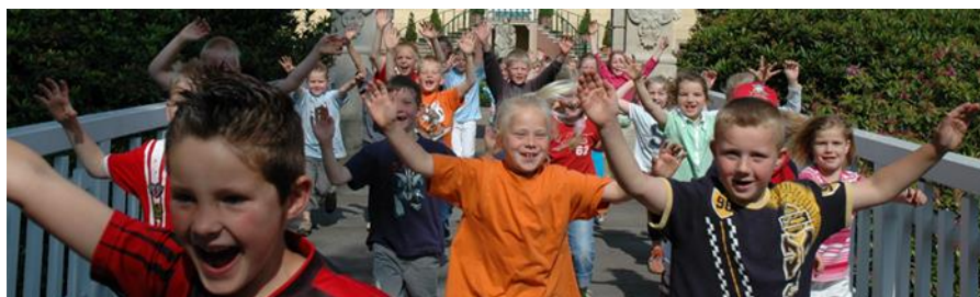
Ferienzentrum Schloss Dankern

Die Stadt verfügt über 80 städtische Spielplätze. Darüber hinaus finden Kinder und Jugendliche weitere vielfältige Freizeitmöglichkeiten über das Stadtgebiet verteilt. Mitte 2025 wird das neuerrichtete, moderne Schwimmbad eröffnet. Acht Sportanlagen werden von unterschiedlichen Sportvereinen für eine Vielzahl von Sportangeboten für Kinder und Jugendliche genutzt. Im Jahr 2023 wurde, auch unter aktiver Beteiligung von Jugendlichen, der Bikepark eingerichtet. Ergänzt wird das Angebot durch das (größtenteils kostenpflichtige) Freizeitangebot des Ferienzentrum Schloss Dankern.