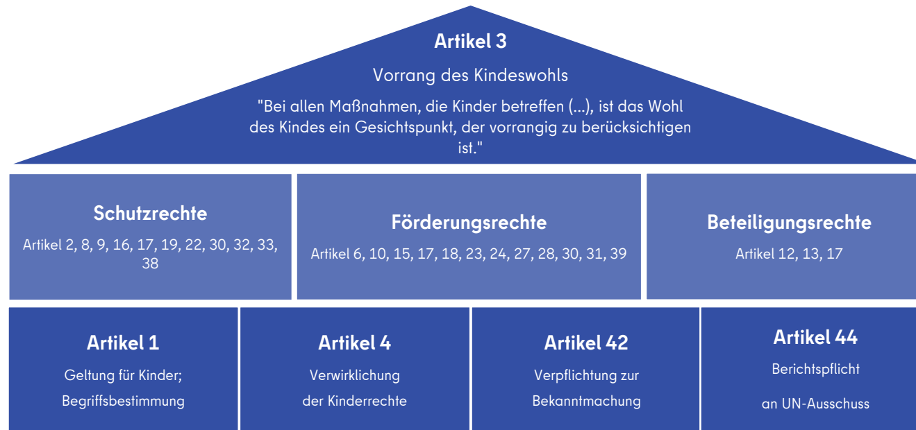
Abbildung 1: Haus der Kinderrechte, Visualisierung SPK 5