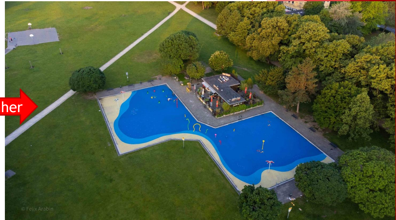
Wasserspielplatz, Innerer Grüngürtel