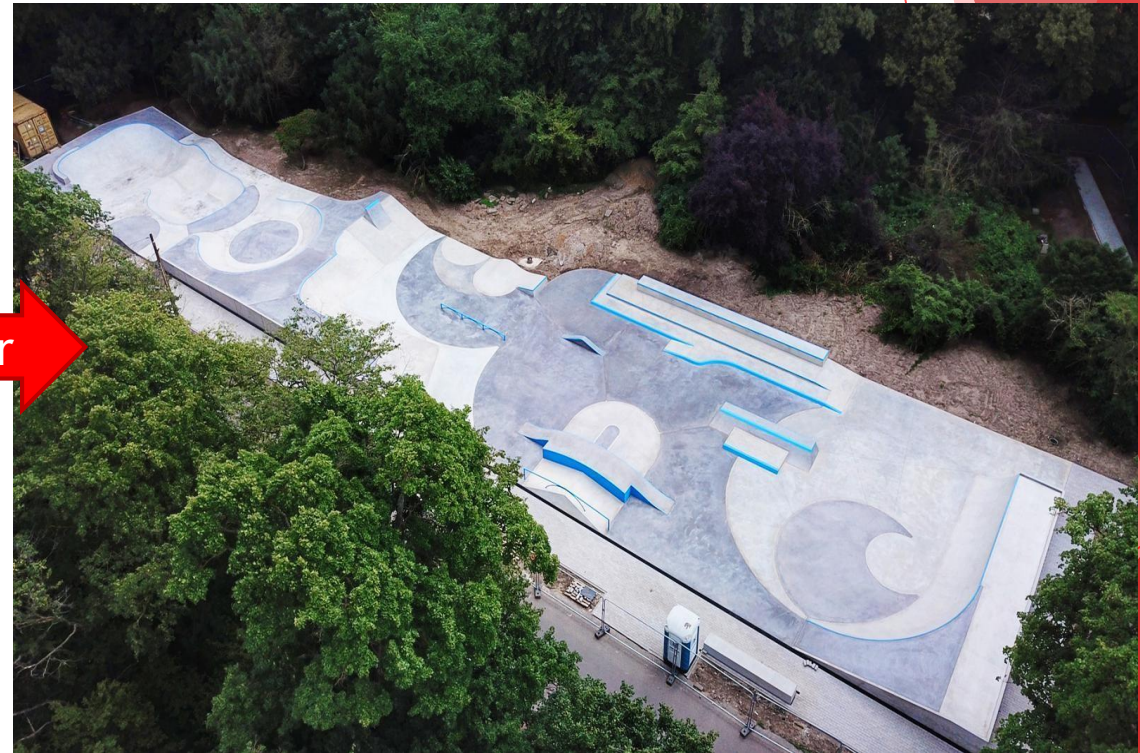
Erste komplett barrierefreier Skateanlage in Köln