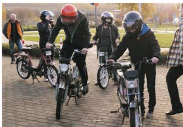
Bad Pyrmont - kinderfreundliche Stadt ● بد پیر منت ، شهری دوستانه برای کودکان است