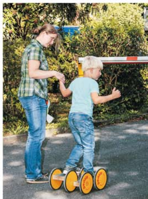
Bad Pyrmont -gyerekbarát város