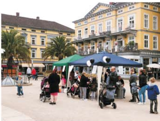
Bad Pyrmont - kinderfreundliche Stadt