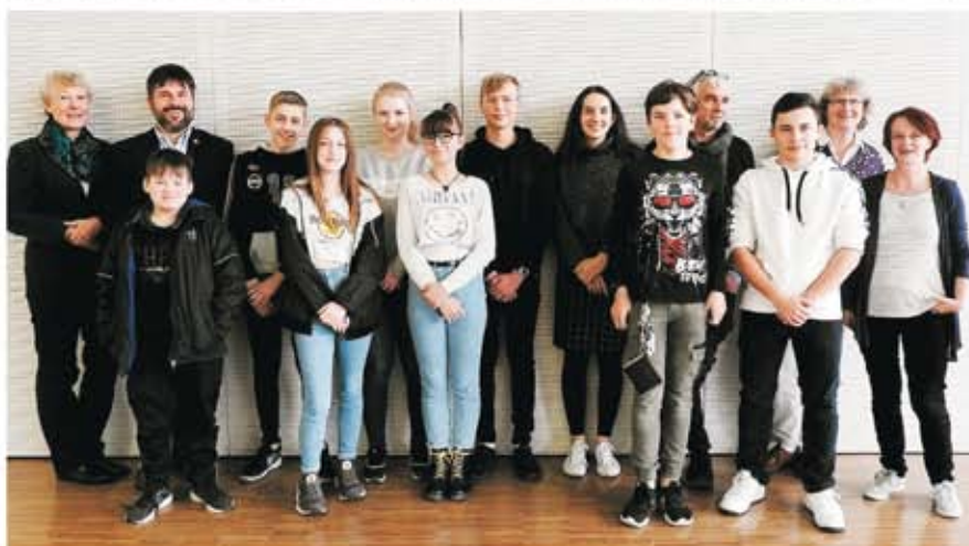
Das aktuelle Jugendparlament

Der Empfehlung, zu prüfen, ob im Kinder- und Jugendbüro zukünftig auch ein/e Kinder und Jugendbeauftragter angesiedelt werden kann, der/die durch Beschluss im politisch-administrativen System mit der notwendigen Autorität und den Aufgaben ausgestattet wird, wird derzeit als nicht prioritär eingeschätzt und soll eher mittelfristig in den Blick genommen werden.